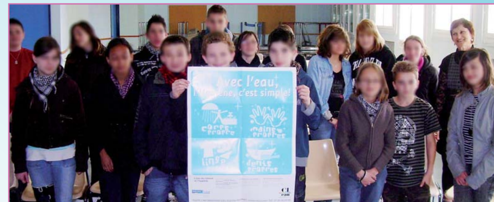
La classe de 5ème D avec les 2 délégués tiennent le poster sur l'hygiène

Quand le soleil est très chaud les personnes boivent de l'eau avec des glaçons, ils en mettent 4 ou 5, la température de leurs corps augmente de 1 ou 2 degrés. Ce n'est pas nous qui décidons si on a envie de boire c'est notre corps qui décide.