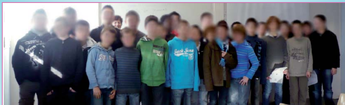
Les élèves délégués et leurs suppléants de 5ème porteurs du projet