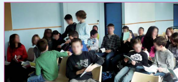
Les 2 élèves délégués de 5ème E distribuent les livrets