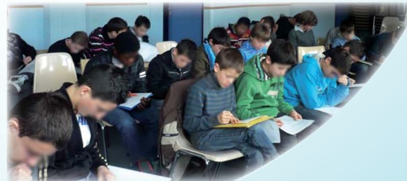
Les élèves de 5ème délégués et suppléants remplissent le questionnaire