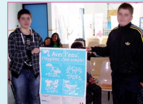
Les 2 élèves délégués de 5ème G