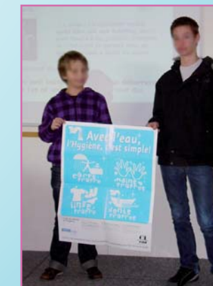
Les 2 élèves délégués de 5ème C