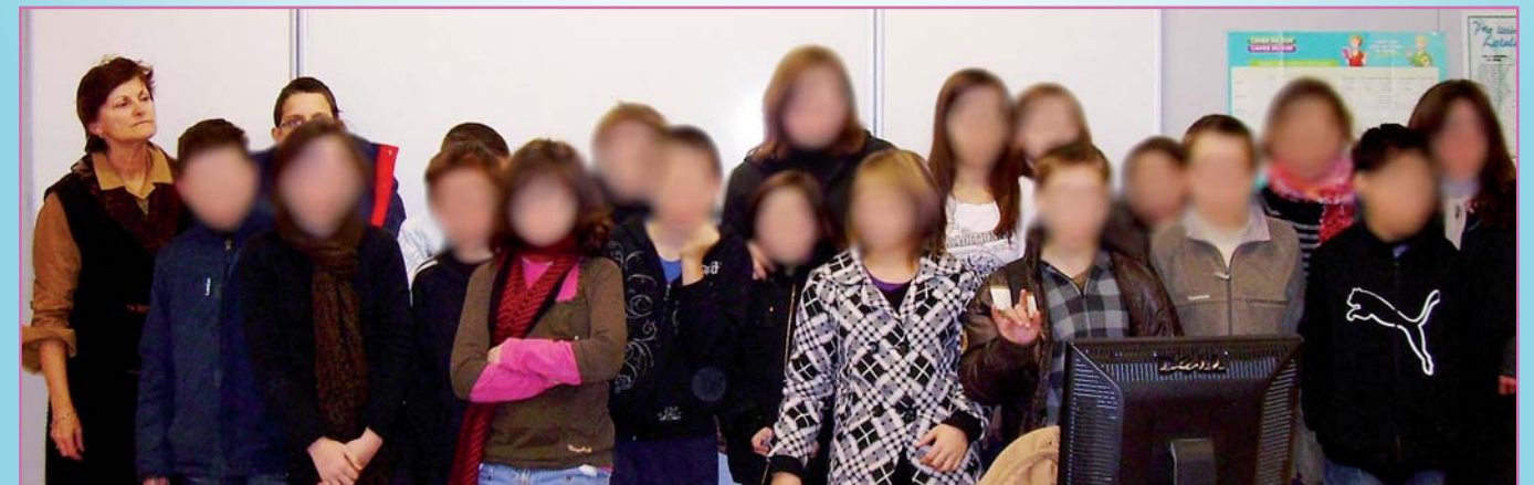
Le groupe de la classe pilote, élèves de niveau 6ème

Monsieur Charrassier chef de l'établissement