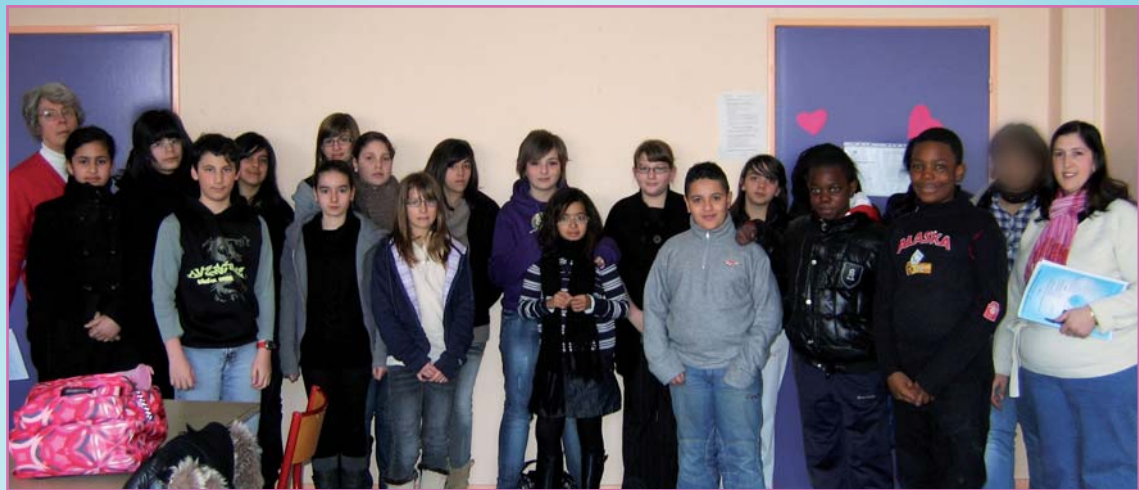
Les élèves délégués du collège Jacques Monod