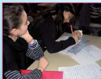
Les élèves remplissent les questionnaires