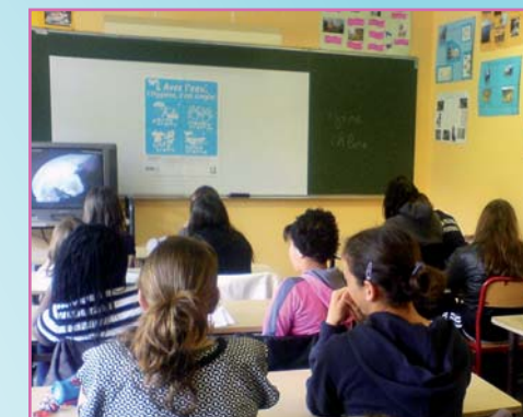
Les collégiens et le film « L'eau : aqua ça sert »

Ces informations sont complétées par l'exposition proposée à toutes les classes du collège au CDI.