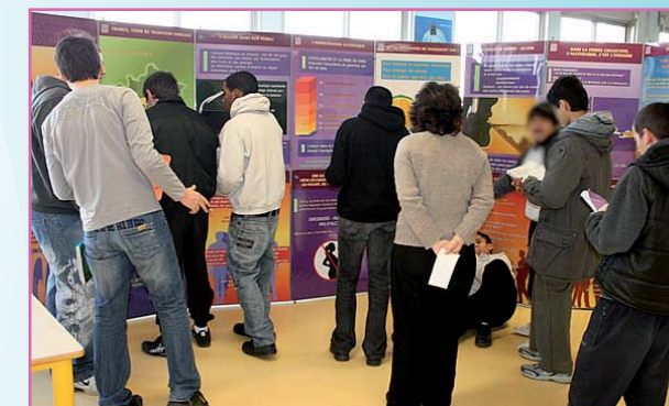
Exposition dans le cadre du forum-santé qui s'est tenue du 15 au 17 décembre 2009 dans le collège